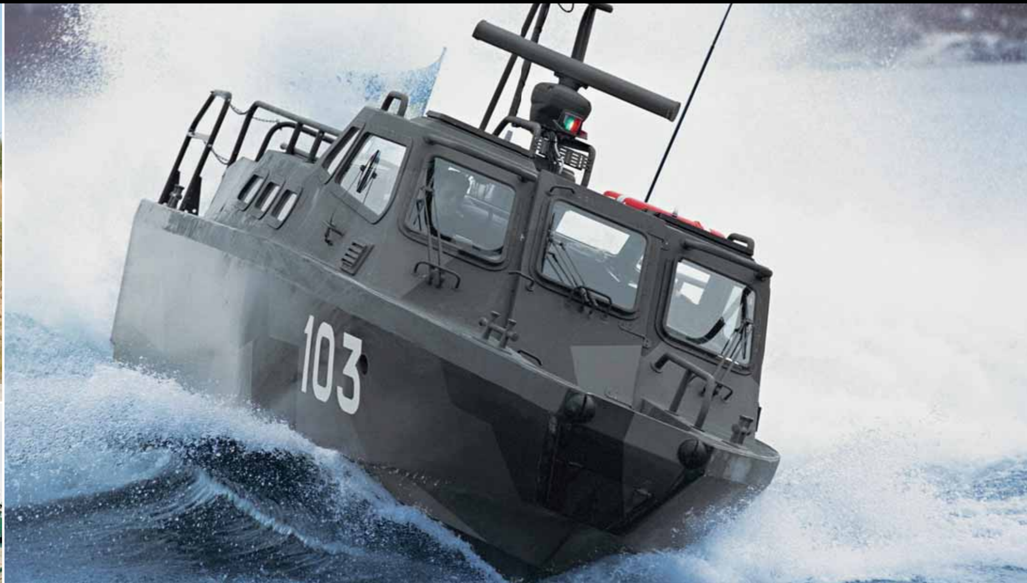
Быстроходный десантный катер 90H, кораблестроительная компания Dockstavarvet, 2 двигателя Scania D114