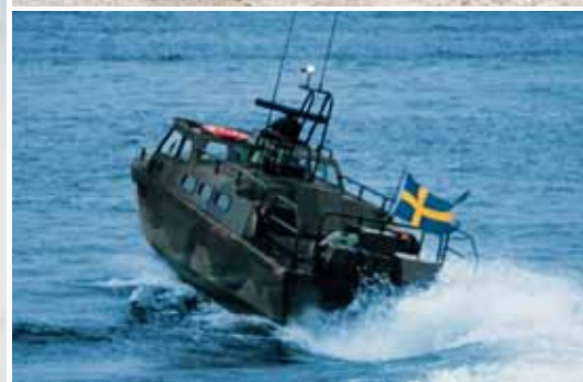
Быстроходный десантный катер 90Е, кораблестроительная компания Storebro, двигатель Scania DI14