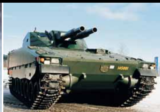
Боевая машина пехоты Hagglunds CV90, двигатель Scania DI16