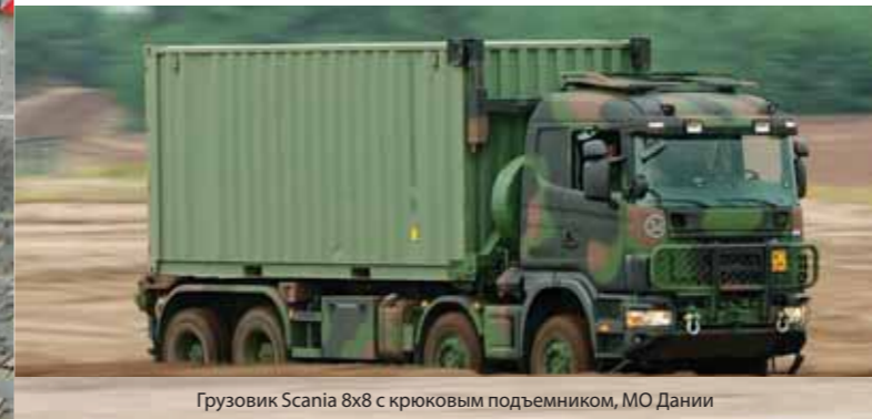
Грузовик Scania 8x8 с крюковым подъемником, МО Дании