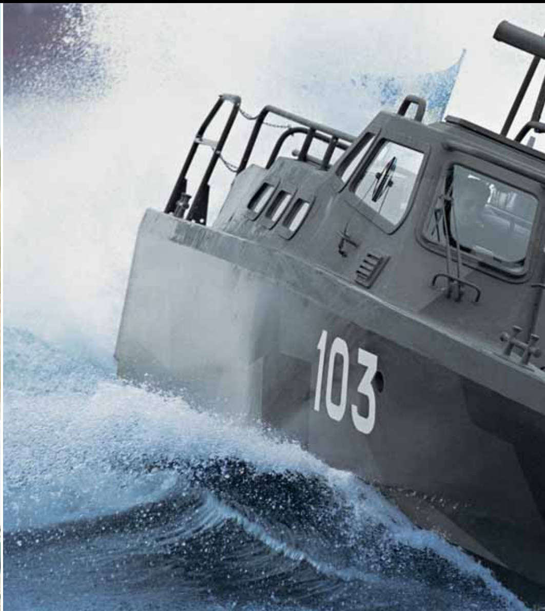
Быстроходный десантный катер 90H, кораблестроительная компания Dockstavarvet, 2 двигателя Scania DI14