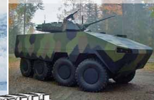
Бронетранспортер Patria AMV (бронированная модульная машина), двигатель Scania D12