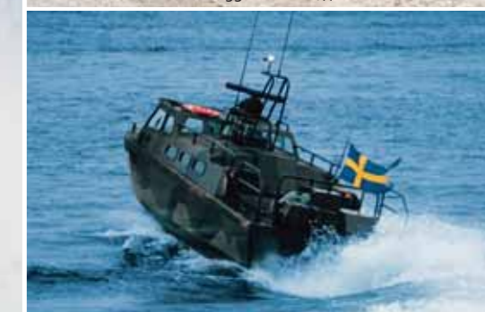
Быстроходный десантный катер 90E, кораблестроительная компания Storebro, двигатель Scania D114