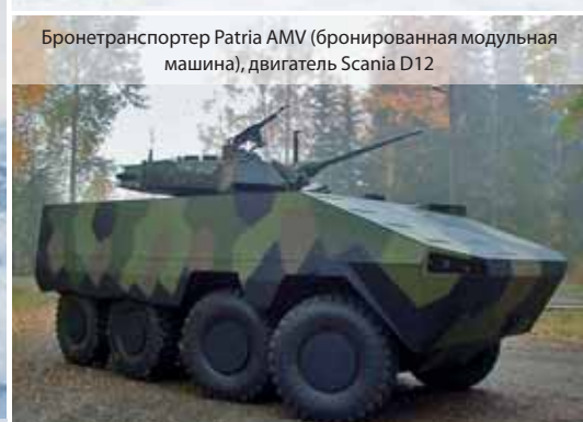
Бронетранспортер Patria AMV (бронированная модульная машина), двигатель Scania D12