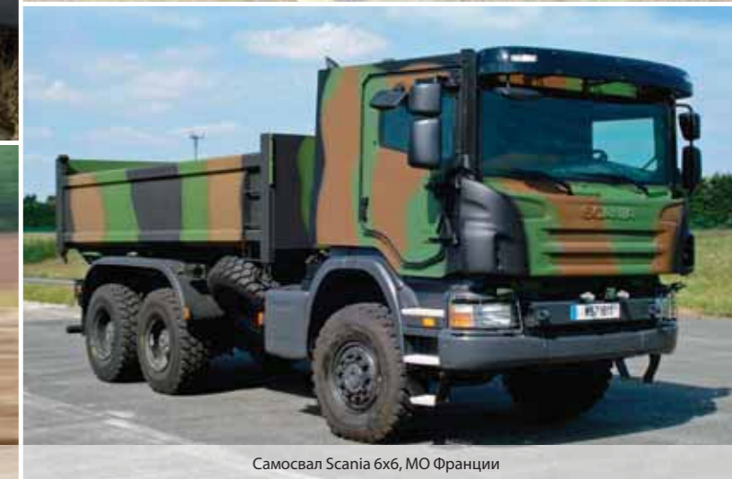
Самосвал Scania 6x6, МО Франции