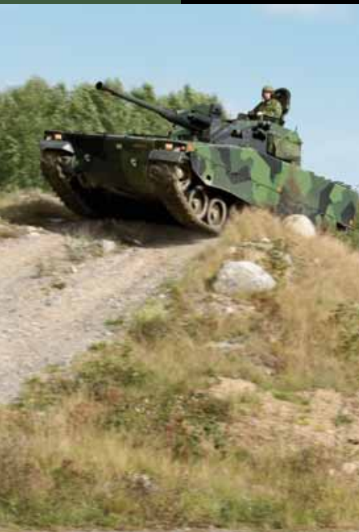
Боевая машина пехоты Hägglunds CV90, двигатель Scania DI16