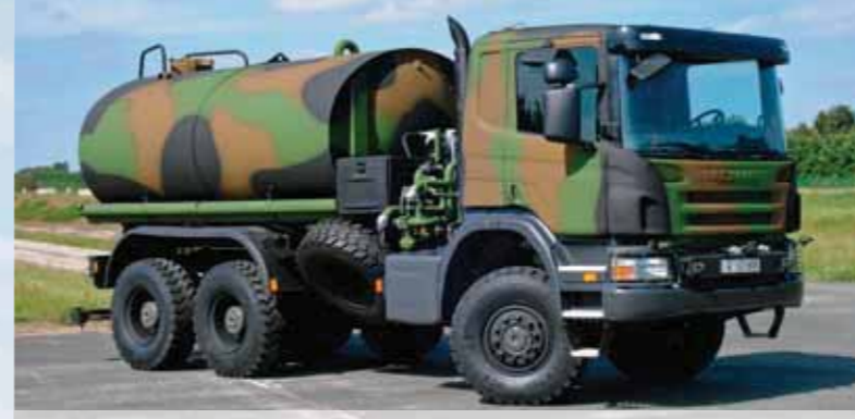
Грузовик Scania 6x6 с цистерной для воды, МО Франции