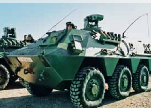
Бронетранспортер BMR, двигатель Scania D9