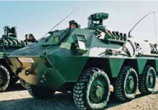
Бронетранспортер BMR, двигатель Scania D9