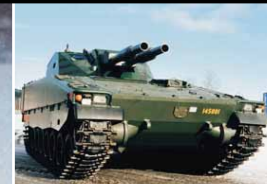
Боевая машина пехоты Hägglunds CV90, двигатель Scania D116