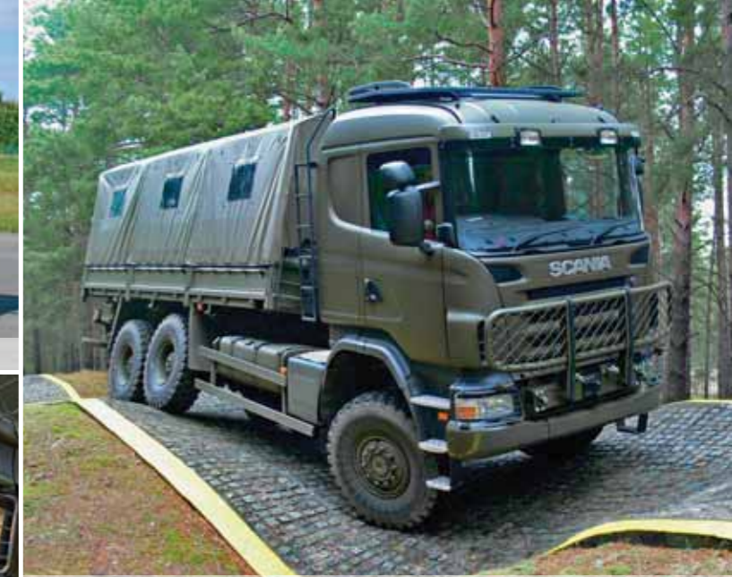
Транспортер Scania 6x6 для перевозки личного состава и грузов, МО Ирландии